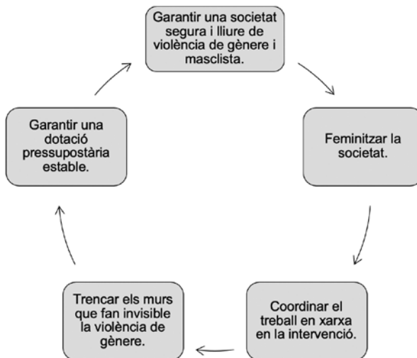
Figura 2. Línies estratègiques del Pacte Valencià

El resultat va derivar en 5 grans línies estratègiques, amb 21 objectius i 293 mesures concretes, que afecten tots els àmbits de l'atenció primària, entitats socials, polítiques, jurídiques, mitjans de comunicació, àmbit educatiu i de la intervenció professional en violència de gènere. Aquestes línies estratègiques són les que es reproduïxen a la figura següent.