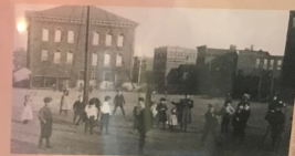
Surrounded by an iron fence, the Hull-House playground had swings and sandboxes, offered May Pole dances, organized games, races, and ice skating in the winter.

La Hull House va promoure la reforma estructural del barri.