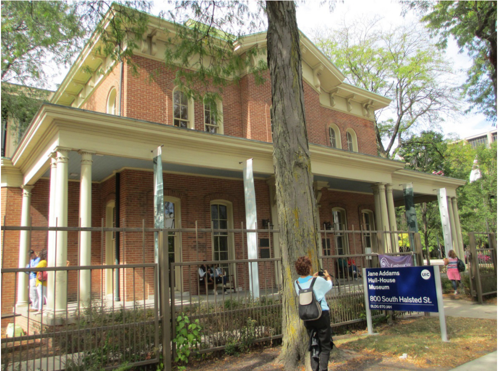
Façana principal de Jane Addams Hull House Museum.