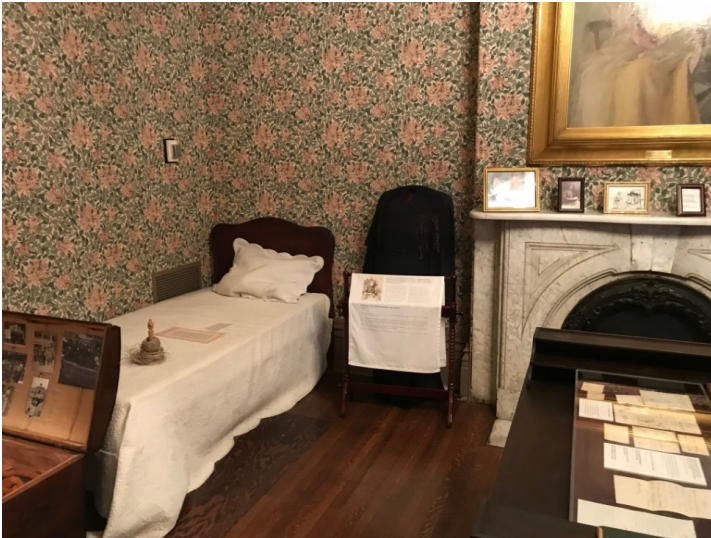
Habitació de Jane Addams a la Hull House.

rat amb la col·laboració al centre. La fórmula de Jane Addams no consistia a oferir col·laboració esporàdica o puntual, els residents vivien a la casa i compartien la forma de vida i els problemes de tots els veïns del barri. L'any 1894 hi havia vint residents.