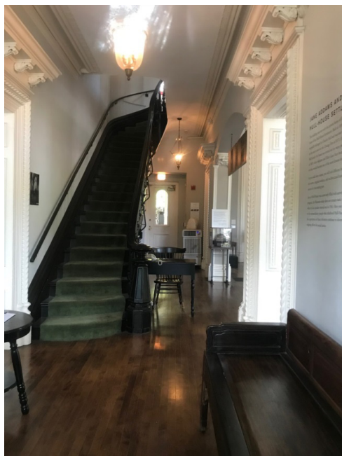
Detall de l'escala del vestíbul de la Hull House.