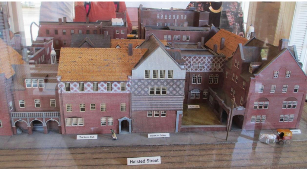
Maqueta d'alguns dels edificis que conformaven la Hull House a principis del segle XX.