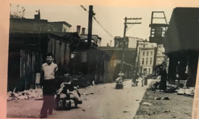
Before the playground was built, children had no place to play but in filthy, garbage-strewn streets.